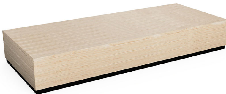
Plate-forme de jeu en mélèze suisse brut, 250 x 100 cm, hauteur de la plate-forme 38 cm, profondeur de montage minimale 50 cm.