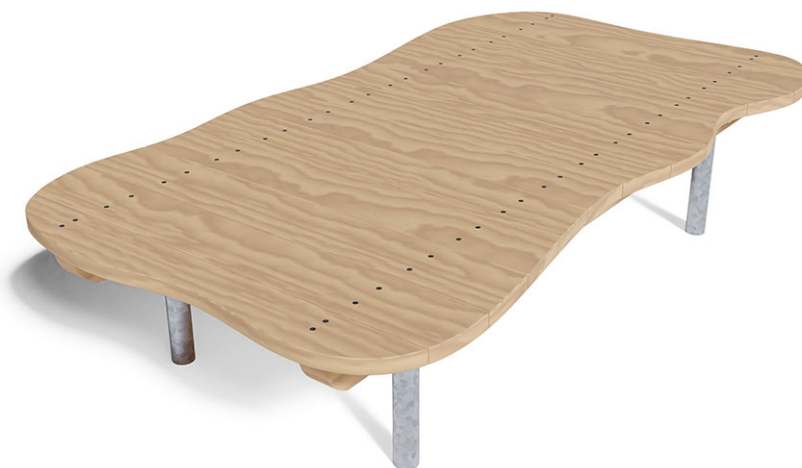
Plate-forme ondulée en mélèze suisse brut, consoles en acier galvanisé à chaud, pour une profondeur de montage minimale de 50 cm.