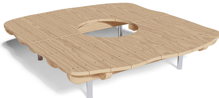
Plate-forme ondulée en mélèze suisse brut, en 2 parties, ø 60 cm, avec consoles en acier galvanisé à chaud, pour une profondeur de montage minimale de 50 cm.