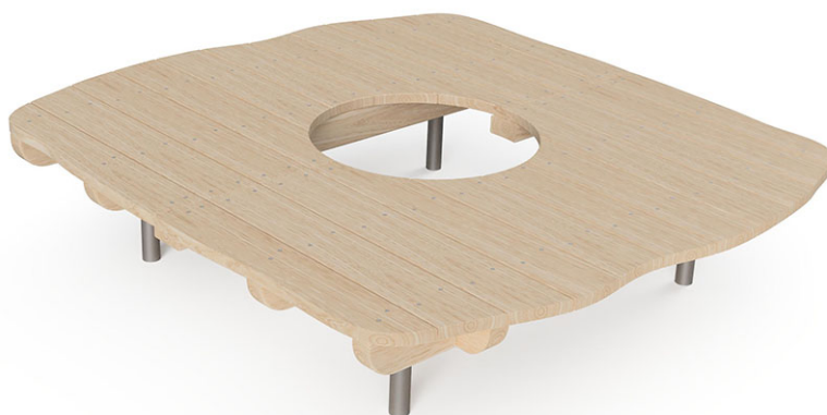
Plate-forme ondulée en mélèze suisse brut, en 2 parties, ø 60 cm, avec consoles en acier galvanisé à chaud, pour une profondeur de montage minimale de 50 cm.