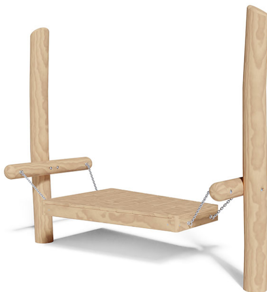
Plate-forme suspendue en bois de robinier meulé et chimique non traité, dispositifs de suspension en acier inoxydable, avec planches en bois de mélèze Suisse brut.